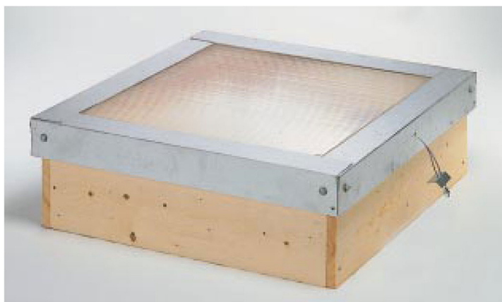
UL med ljusgenomsläppligt lock