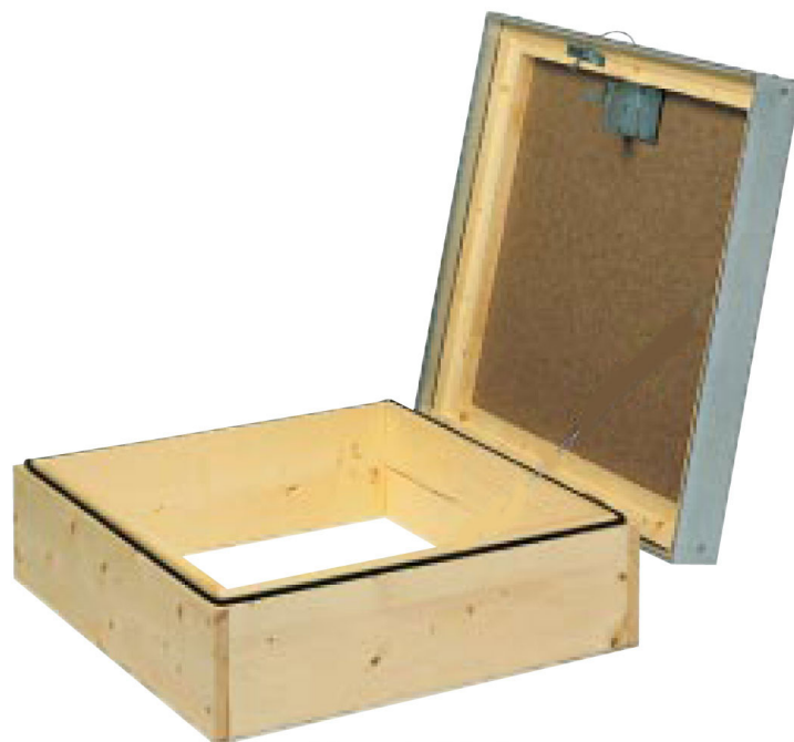
UL med plåtlock